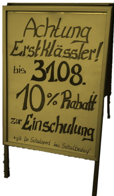
Kundenstopper

Nahende Termine erzeugen ein Gefühl der Dringlichkeit im AIDA-Prozess